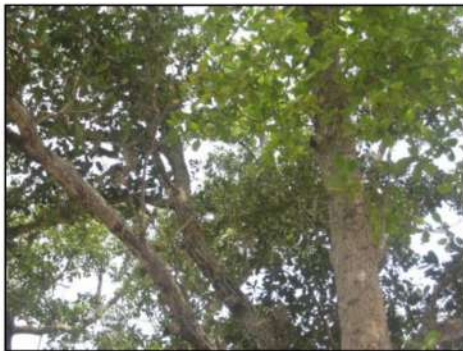
Pokok Buah Panago

Asal nama Sungai Panago ialah bersumberkan dialek Dusun iaitu merujuk kepada nama sejenis tumbuhan pokok yang dahulunya banyak tumbuh di kawasan tersebut.