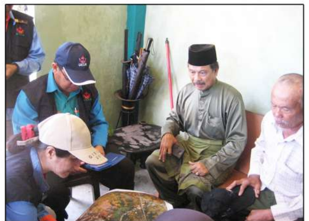
temubual dengan Ketua Kampung