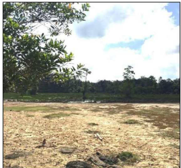
Paya Nak Tuno

Menurut ristaan beberapa orang penduduk di kawasan ini bahawa penamaan “Nak Tuno” bersumberkan dialek Dusun. Nak Tuno bermakna bukit kecil yang dikelilingi oleh paya, belukar, dan tanah rendah.