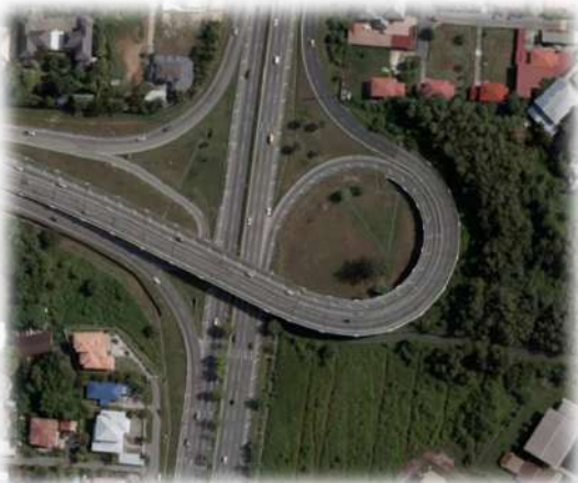
Jejambat Pangkalan Gadong