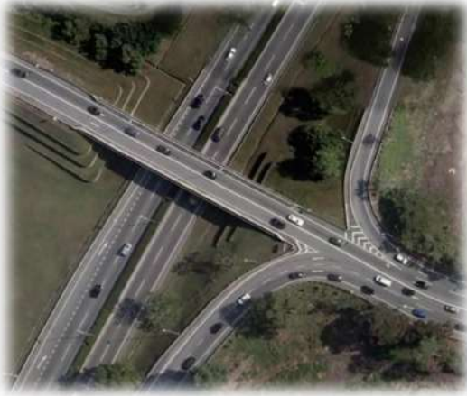
Jejambat Kompleks jabatan Kerajaan