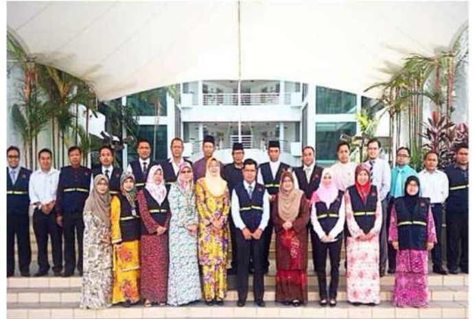
AHLI JKNG 2007–2015