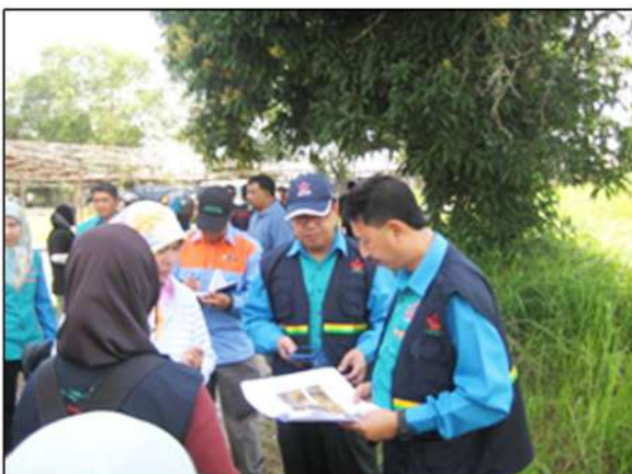
Perbincangan toponimi di lokasi.