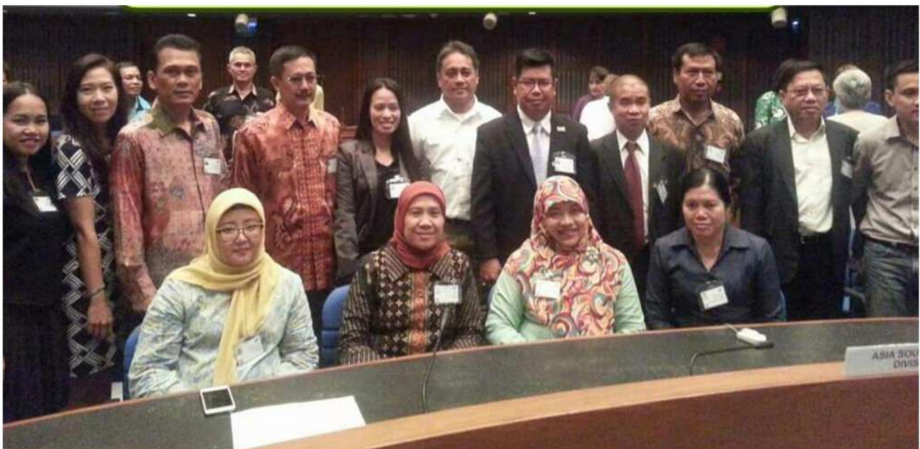
Pengerusi JKNG Negara Brunei Darussalam bersama perwakilan luar negara

Mesyuarat dibahagikan kepada beberapa bahagian, iaitu Penyampaian Laporan, Taklimat Khas, Division Meeting dan Pameran. Antara perkara yang dimuatkan dalam atur cara ialah laporan pengerusi dan urus setia, laporan daripada setiap zon, dan laporan projek-projek khas yang menjurus kepada nama geografi.