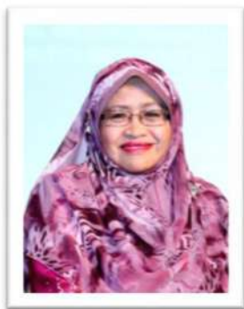
Yang Mulia Dayang Hajah Aminah binti Haji Momin Timbalan Pengerusi 2009–Oktober 2015