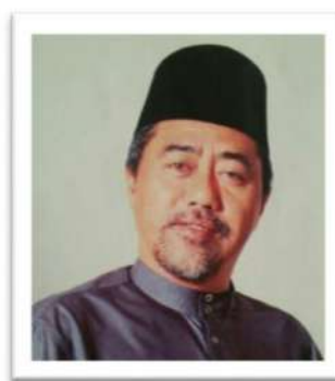
Yang Mulia Awang Matusin bin Haji Abu Bakar Urus Setia 2006–Oktober 2013