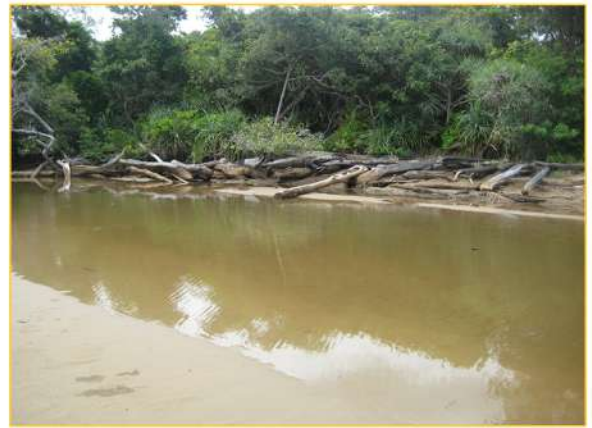
Sungai Binturan Besar