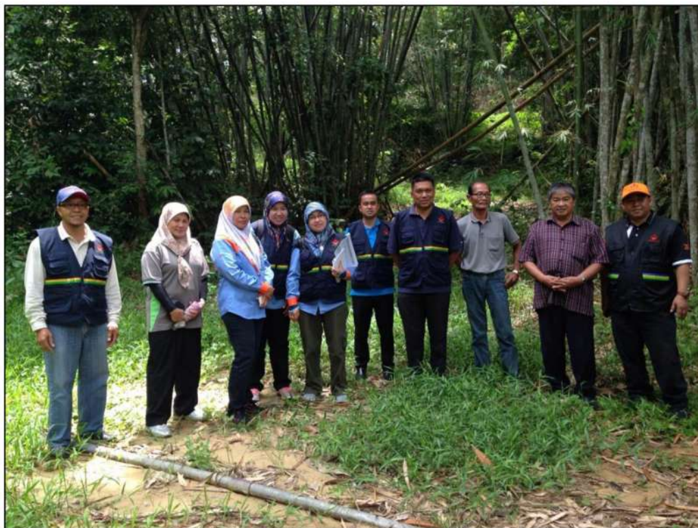
Ahli dan Urus Setia JKNG berada di atas Bukit Buayan Banji