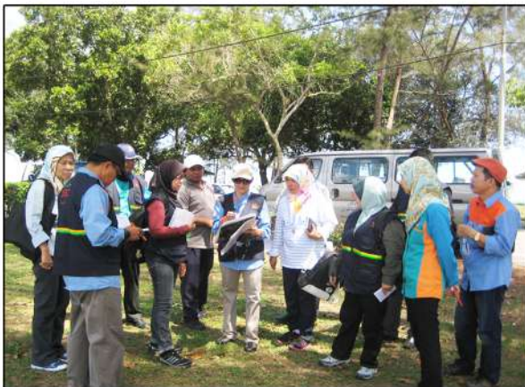
Pantai Seri Kenangan