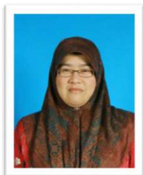
Yang Mulia Dayang Hajah Rosimah binti Haji Ibrahim Urus Setia 2009–Oktober 2015